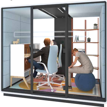
hushmeet.L W przestronnej kabinie hushMeet.L grupa uczniów współpracuje przy nowej odsłonie gazetki szkolnej.