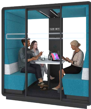
hushmeet W komfortowej kabinie hushMeet rodzice spotkali się z wychowawczynią swojej córki.