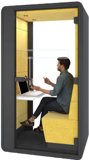
hushhybrid W kabinie hushHybrid odbywają się właśnie dodatkowe zajęcia językowe on-line.