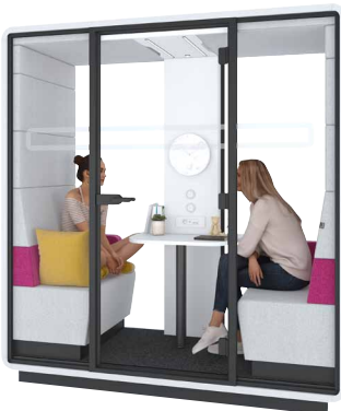
hushmeet.S W kabinie hushMeet.S trwa poufne spotkanie ucznia z psychologiem szkolnym.