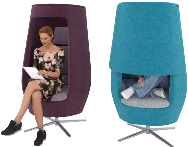
Fotele A11 W fotelach A11 jedni uczniowie odpoczywają przed kolejnymi zajęciami, inni przypominają sobie materiał przed kartkówką.