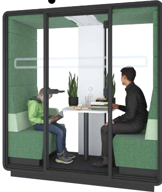
hushmeet.S W kabinie hushMeet.S nauczyciel zorganizował zajęcia wyrównawcze dla jednego ze swoich uczniów.