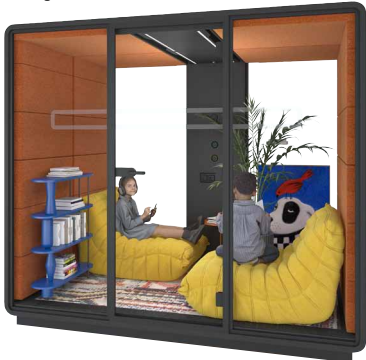
hushmeet.L W specjalnie zaaranżowanej kabinie hushMeet.L uczniowie relaksują się, odcinając się od zewnętrznych bodźców.